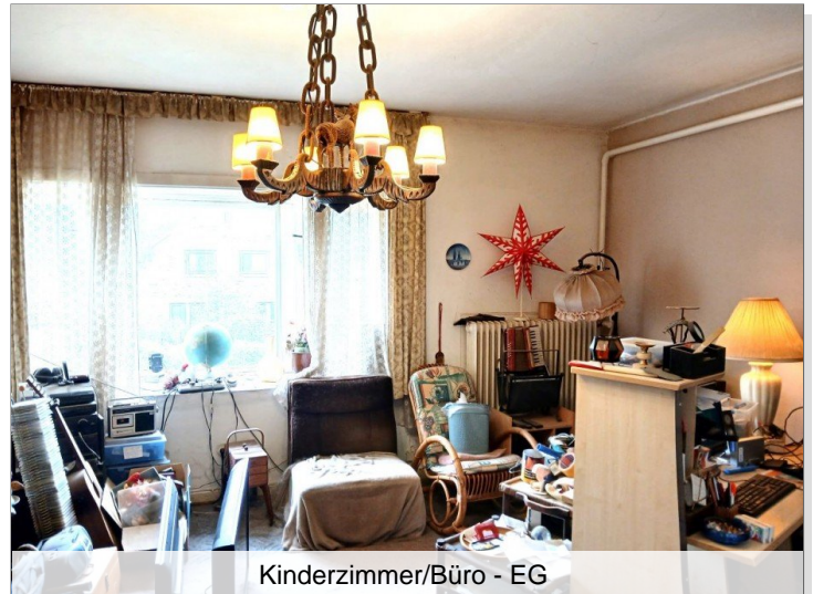
Kinderzimmer/Büro - EG