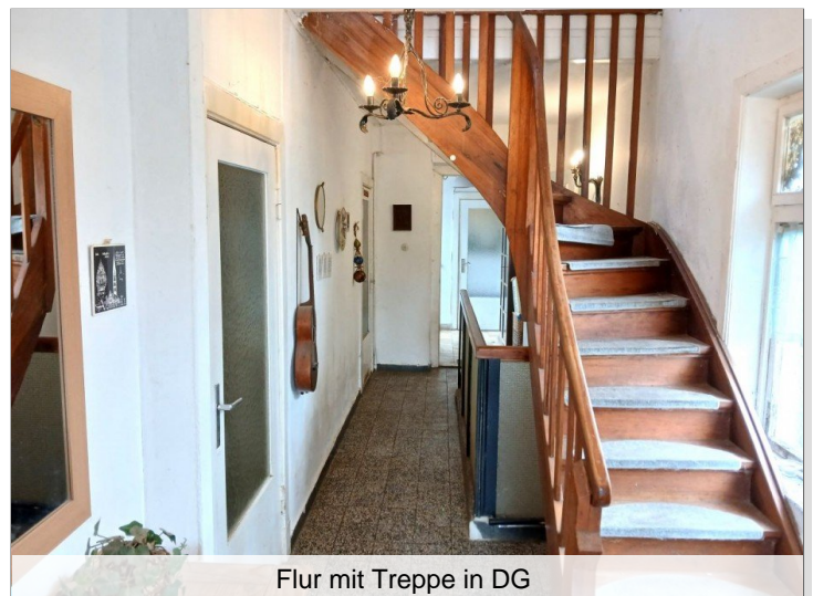
Flur mit Treppe in DG