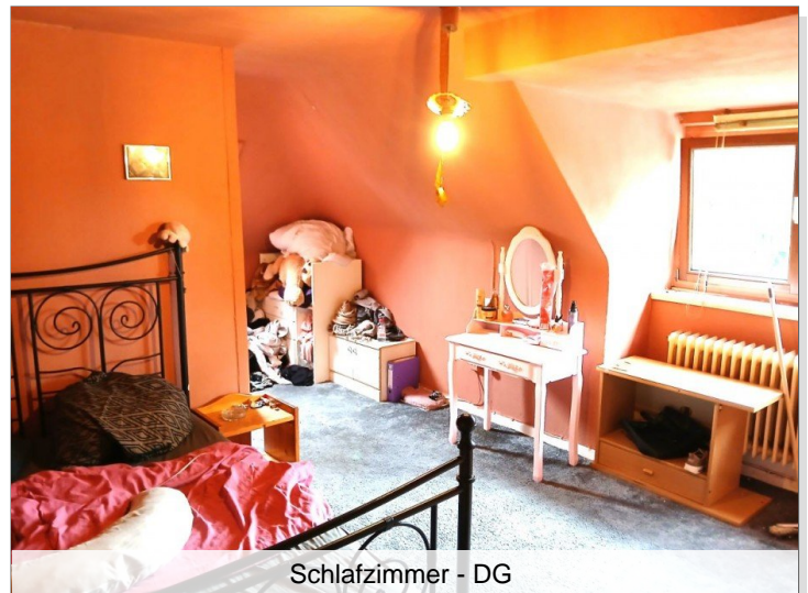
Schlafzimmer - DG