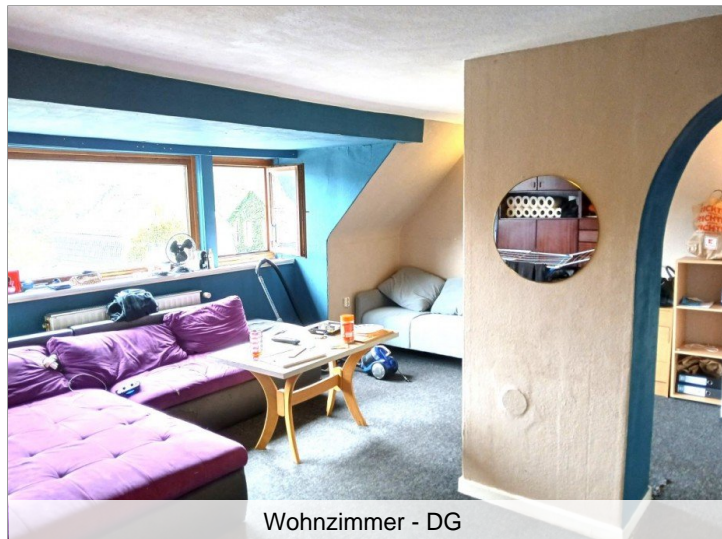
Wohnzimmer - DG