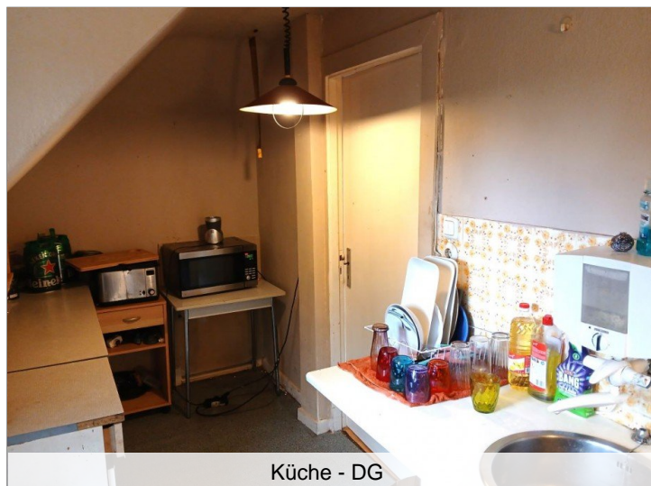
Küche - DG