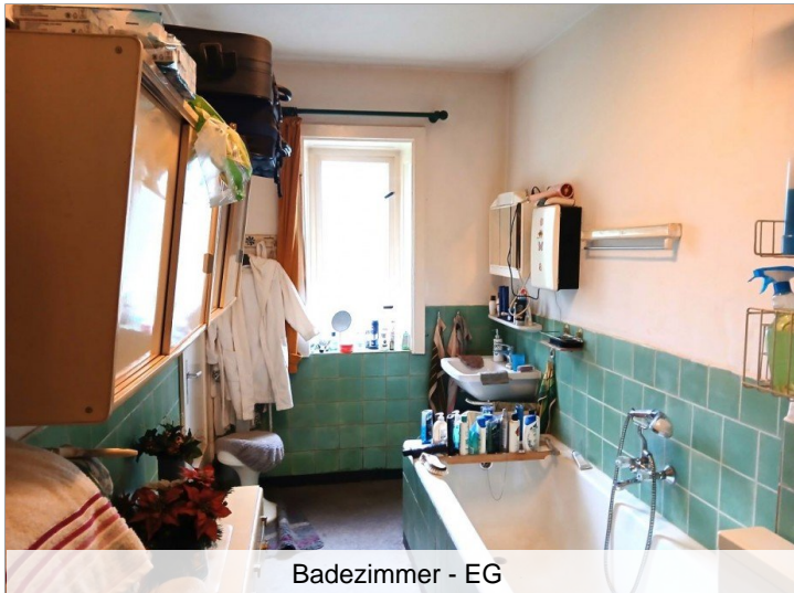
Badezimmer - EG