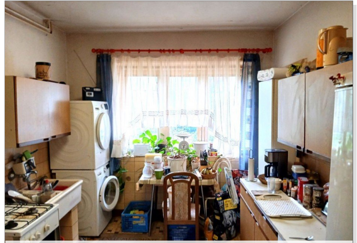
Küche - EG