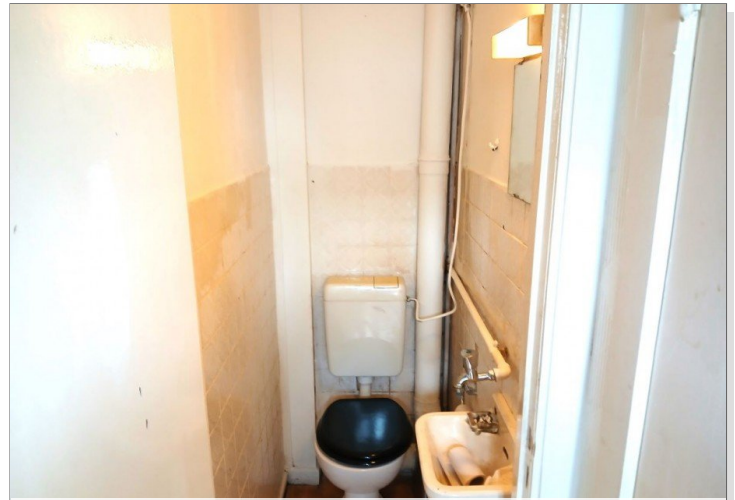
WC - DG