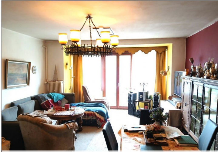
Wohnzimmer - EG