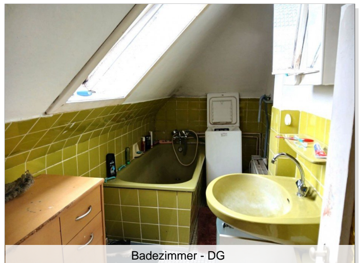
Badezimmer - DG