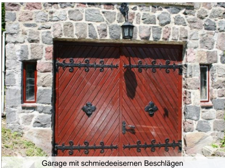
Garage mit schmiedeeisernen Beschlägen