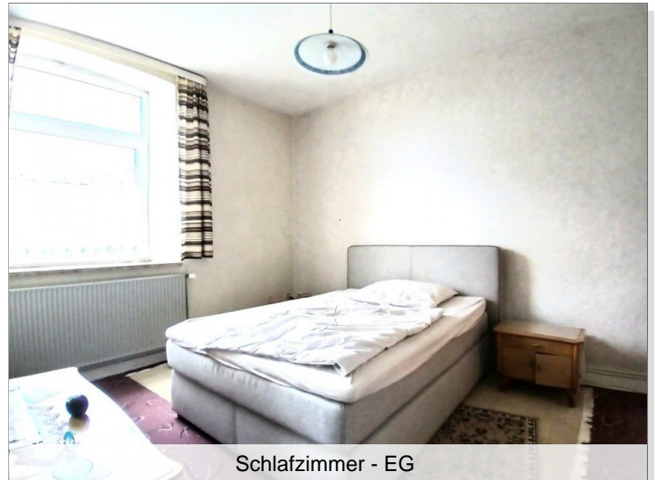
Schlafzimmer - EG