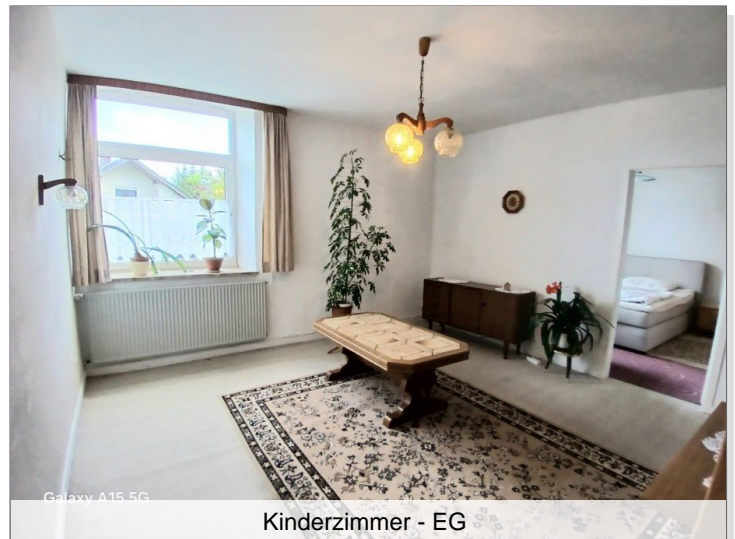
Kinderzimmer - EG