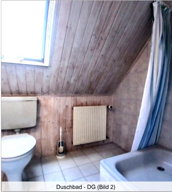
Duschbad - DG (Bild 2)