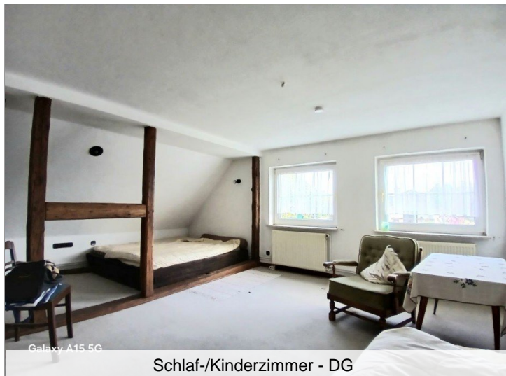
Schlaf-/Kinderzimmer - DG