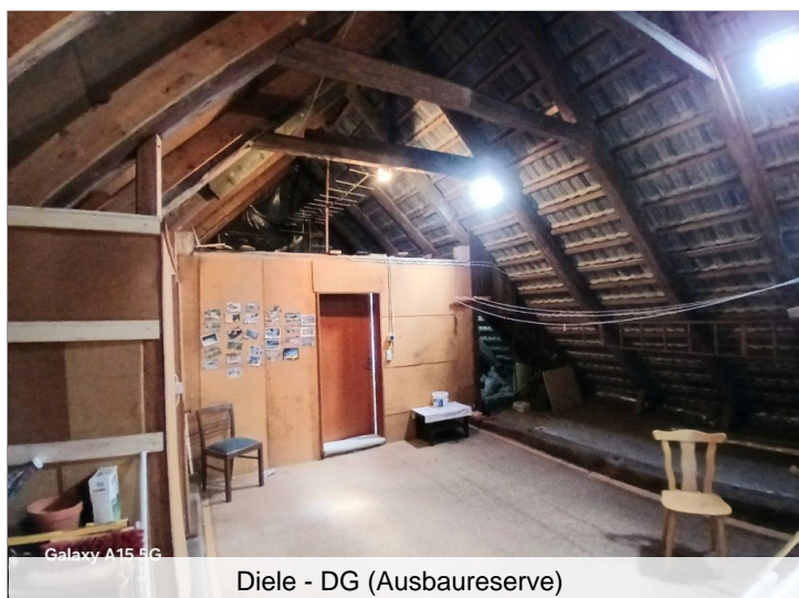
Diele - DG (Ausbaureserve)