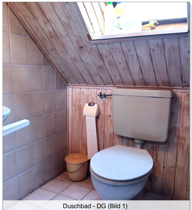
Duschbad - DG (Bild 1)