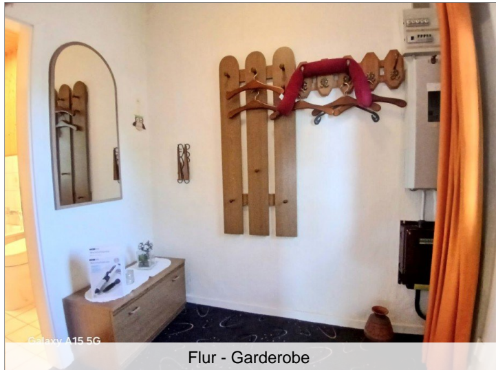
Flur - Garderobe