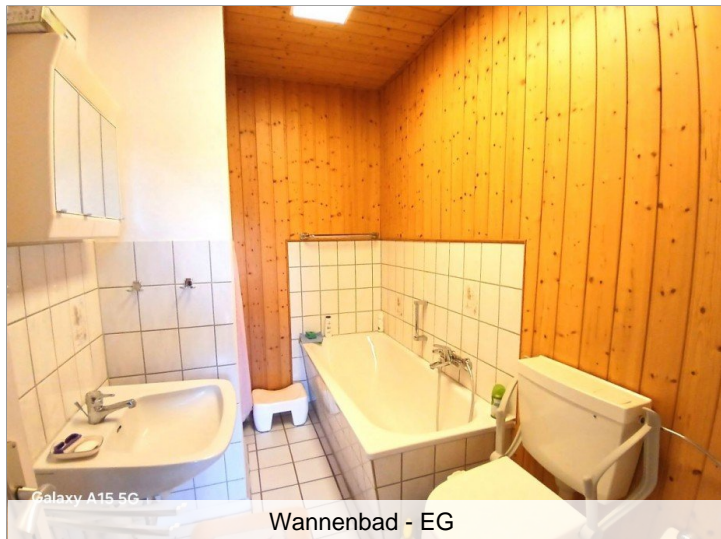
Wannenbad - EG