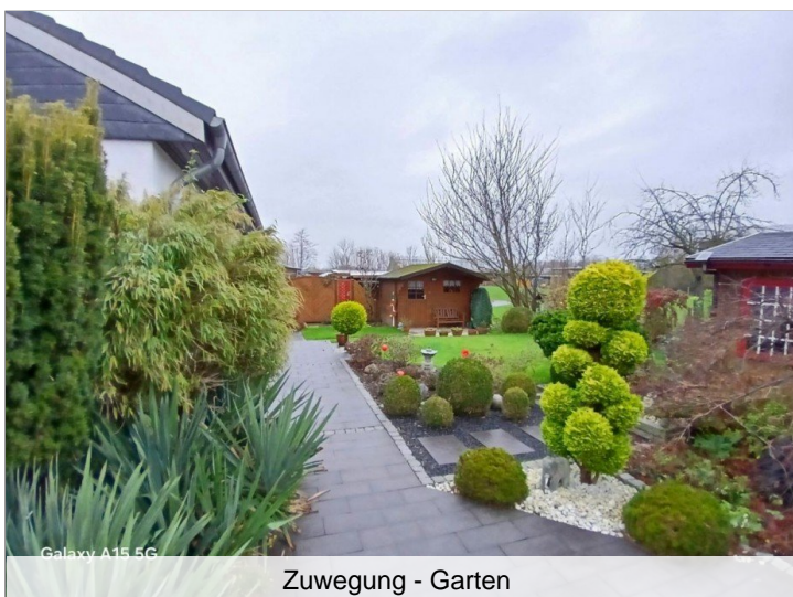
Zuwegung - Garten