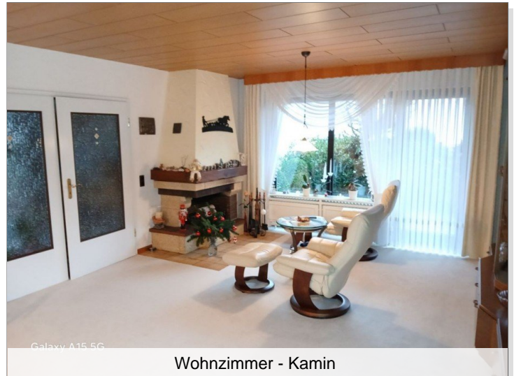
Wohnzimmer - Kamin