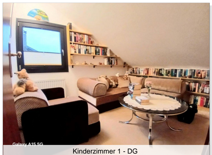
Kinderzimmer 1 - DG