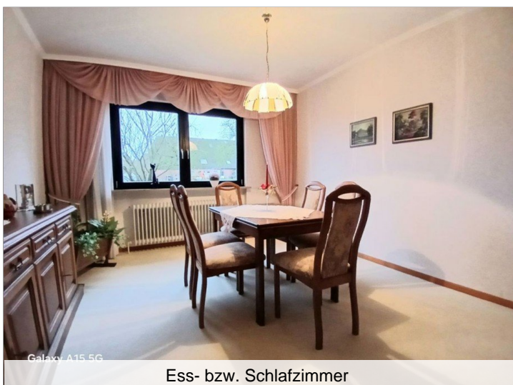
Ess- bzw. Schlafzimmer