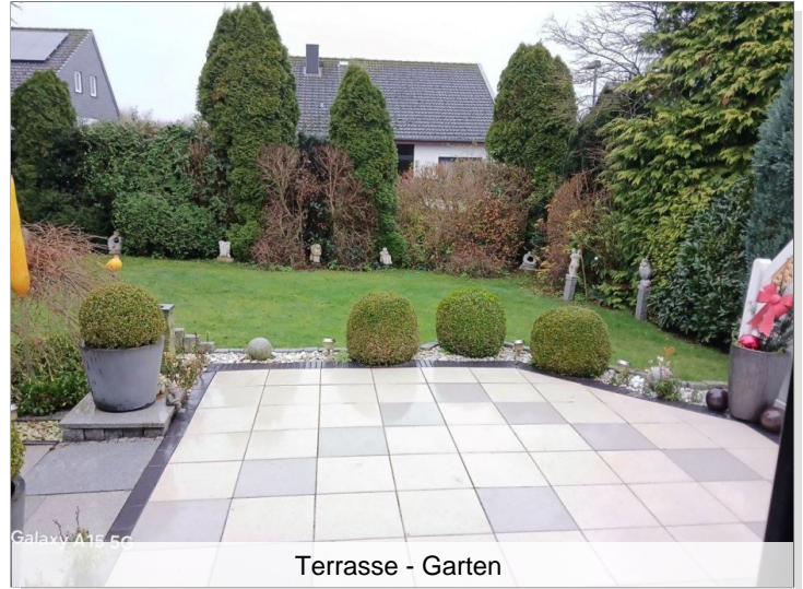
Terrasse - Garten