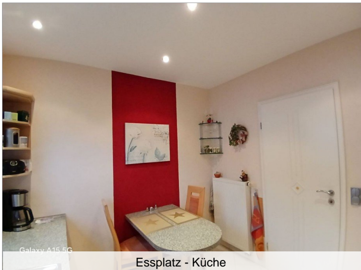
Essplatz - Küche