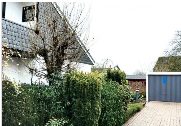
Auffahrt - Garage