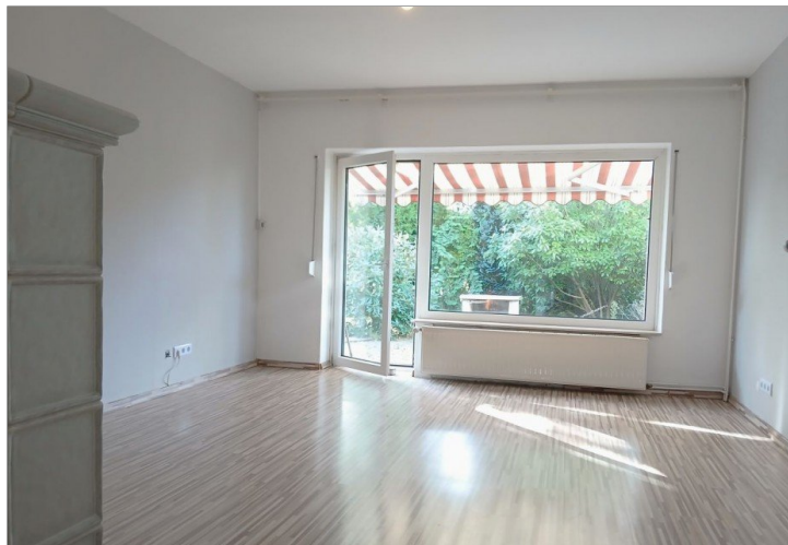
Wohnzimmer (Bild 1)