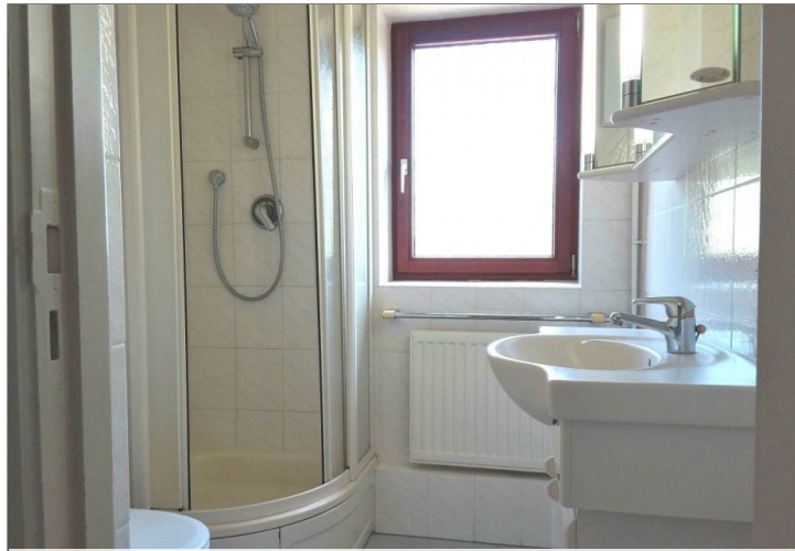
Badezimmer - OG