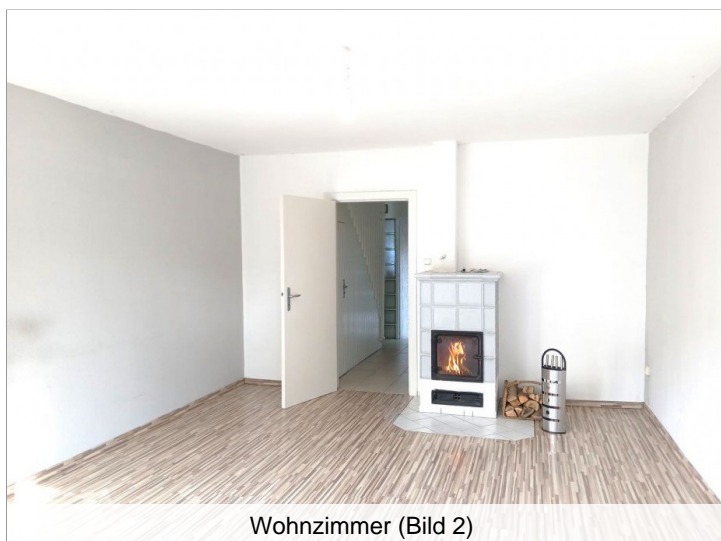
Wohnzimmer (Bild 2)