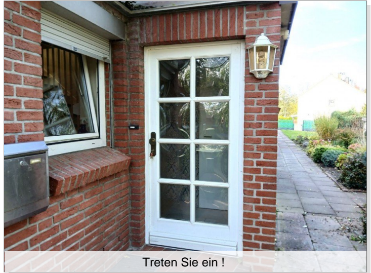
Treten Sie ein !