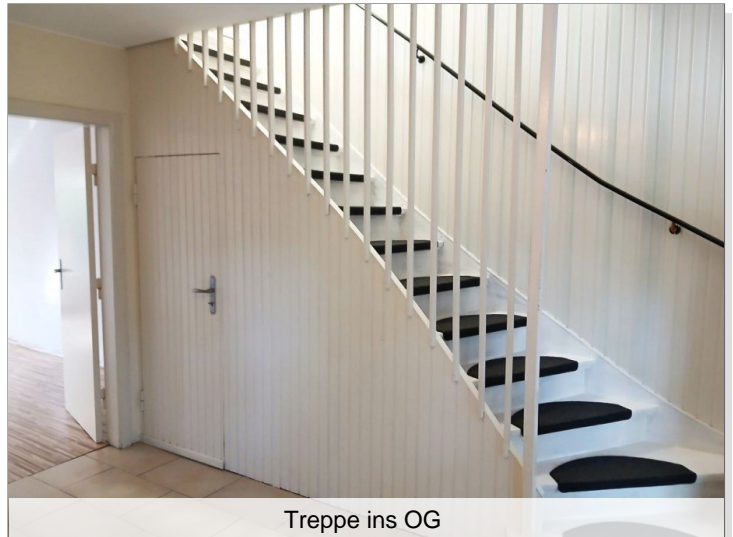
Treppe ins OG