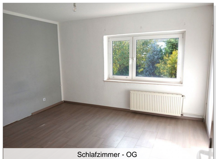
Schlafzimmer - OG