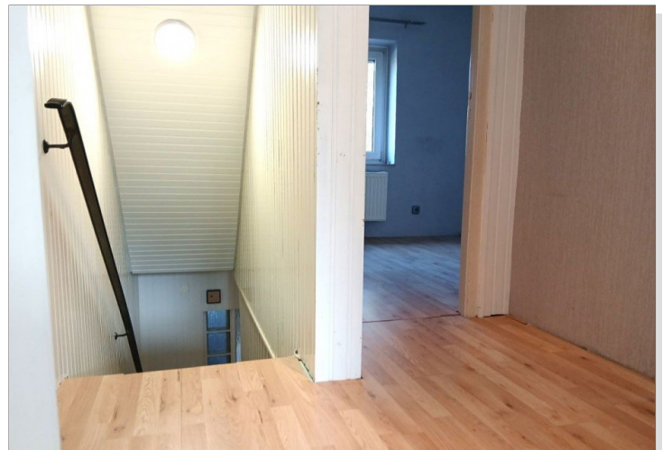
Flur - OG