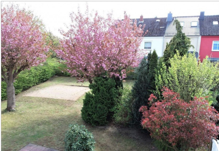
Garten (Bild 1)