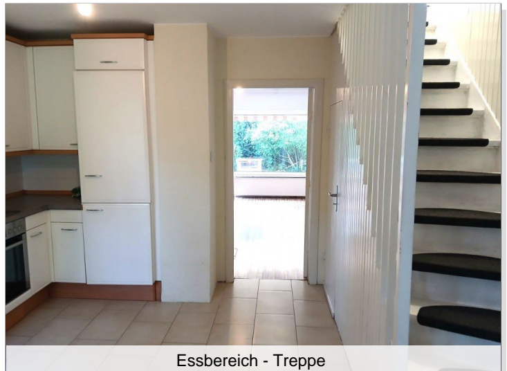
Essbereich - Treppe