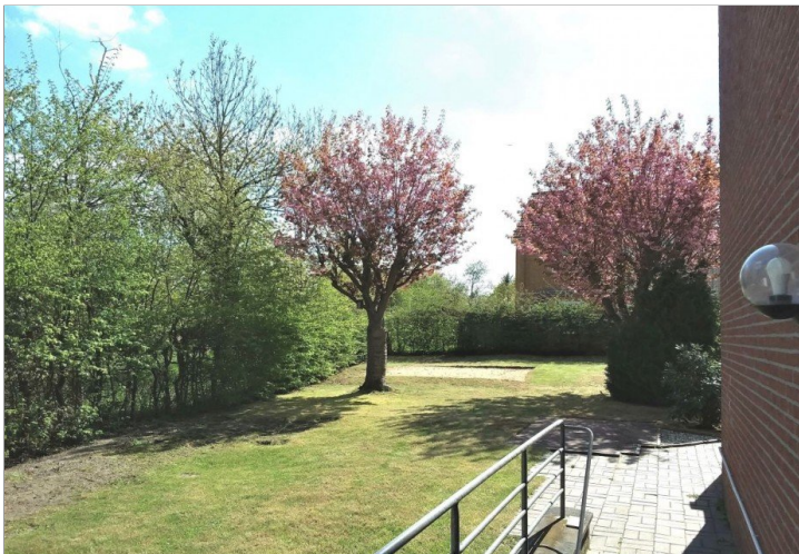
Garten (Bild 2)