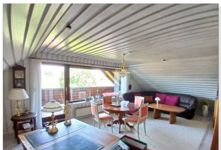
Großes Zimmer - DG (Ansicht 1)