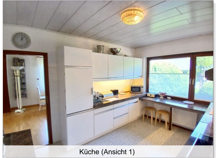
Küche (Ansicht 1)