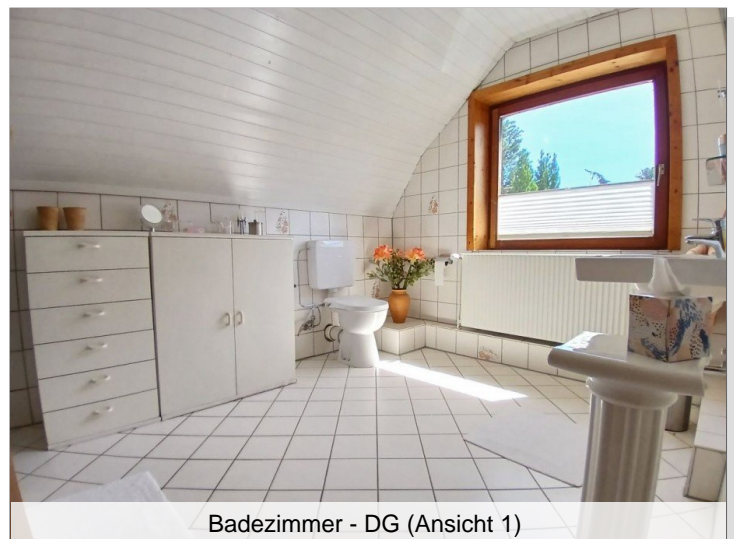
Badezimmer - DG (Ansicht 1)