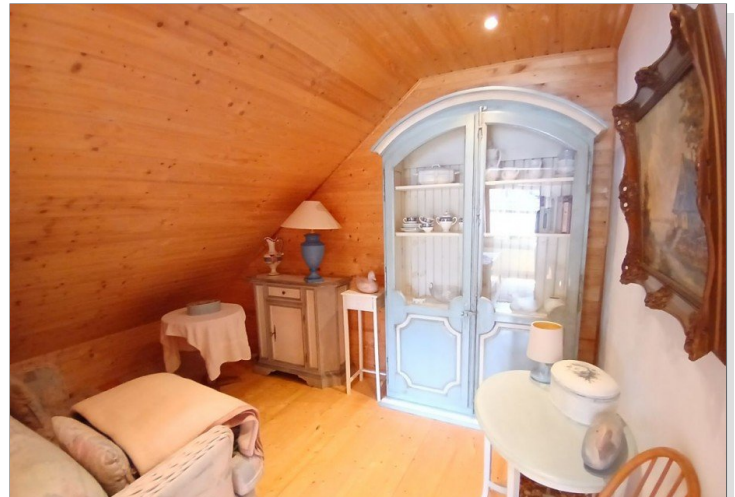
Ankleidezimmer - DG