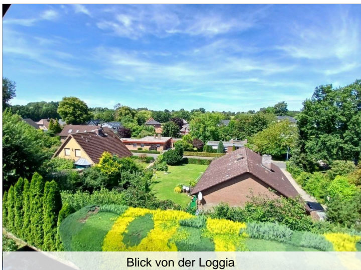
Blick von der Loggia