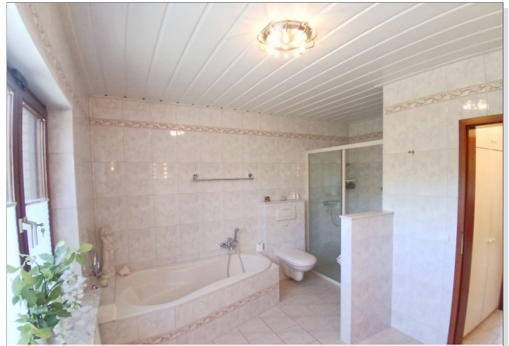
Vollbad (Ansicht 2)