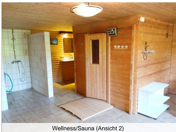
Wellness/Sauna (Ansicht 2)