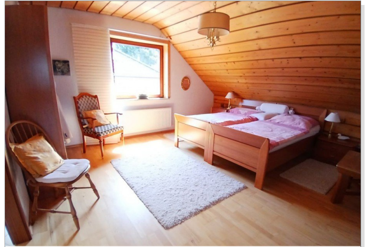
Schlafzimmer - DG