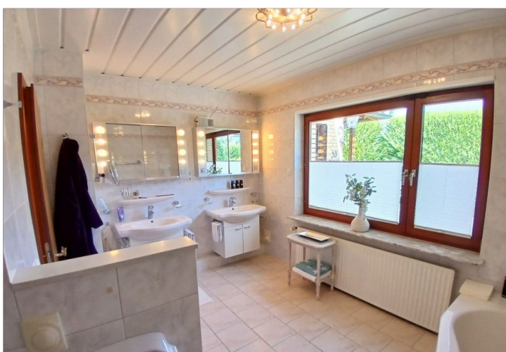
Vollbad (Ansicht 1)