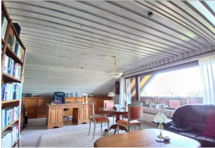
Großes Zimmer - DG (Ansicht 2)