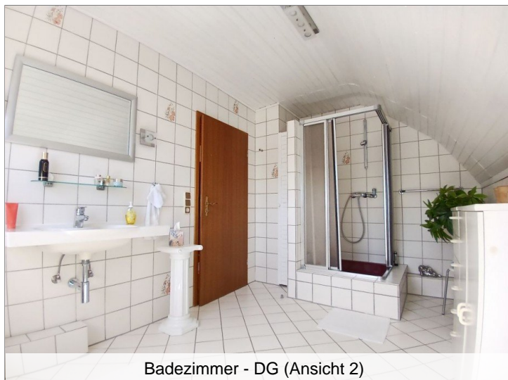
Badezimmer - DG (Ansicht 2)