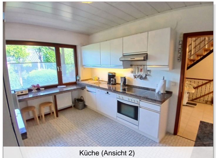
Küche (Ansicht 2)