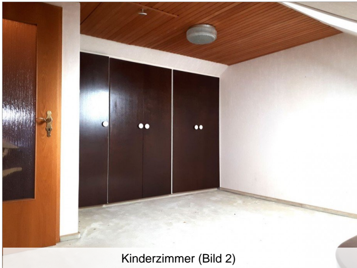
Kinderzimmer (Bild 2)