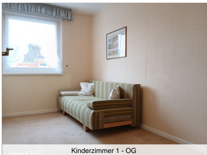
Kinderzimmer 1 - OG