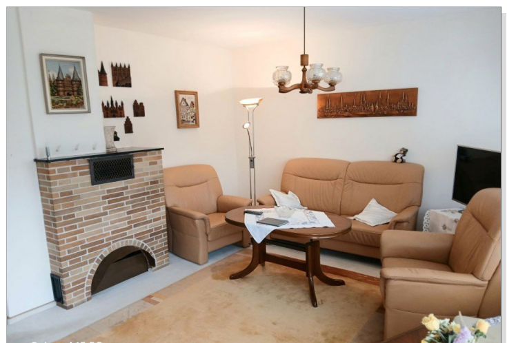
Wohn-/Essbereich (Bild 3)