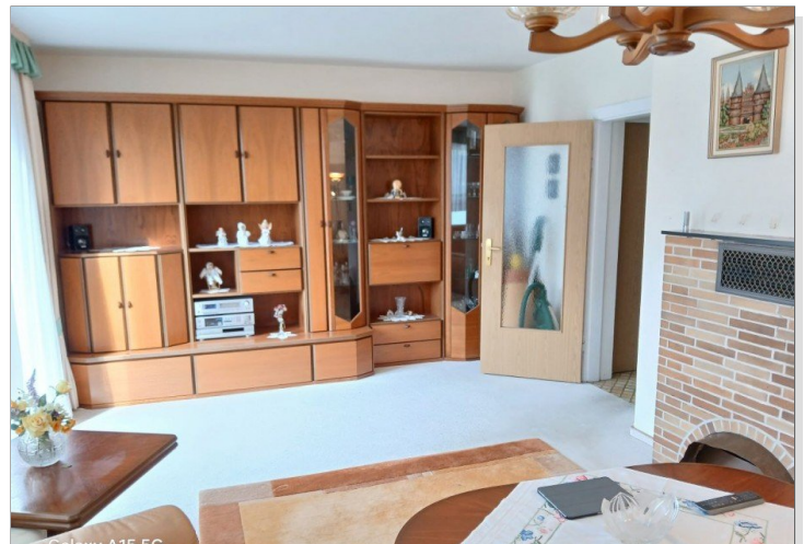
Wohn-/Essbereich (Bild 2)