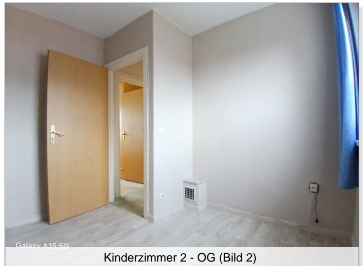
Kinderzimmer 2 - OG (Bild 2)