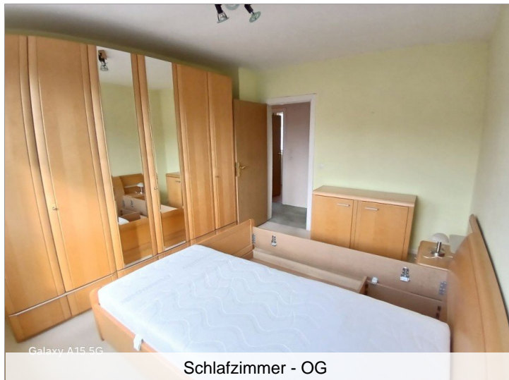
Schlafzimmer - OG