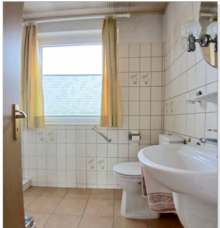
Bad - OG (Bild 1)