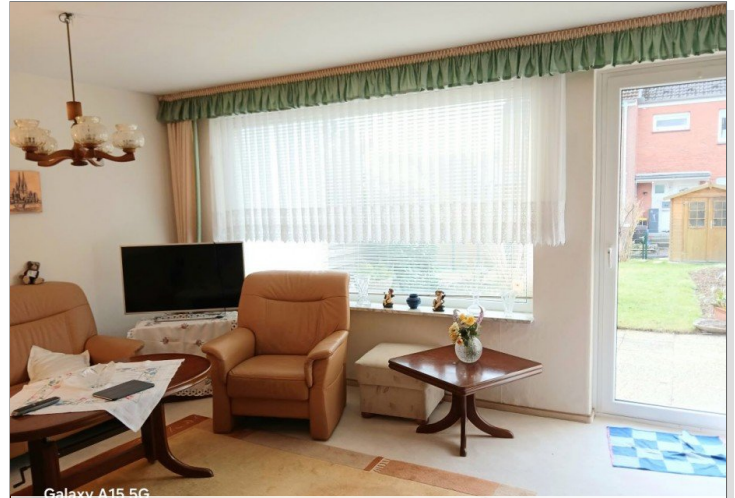
Wohn-/Essbereich (Bild 1)