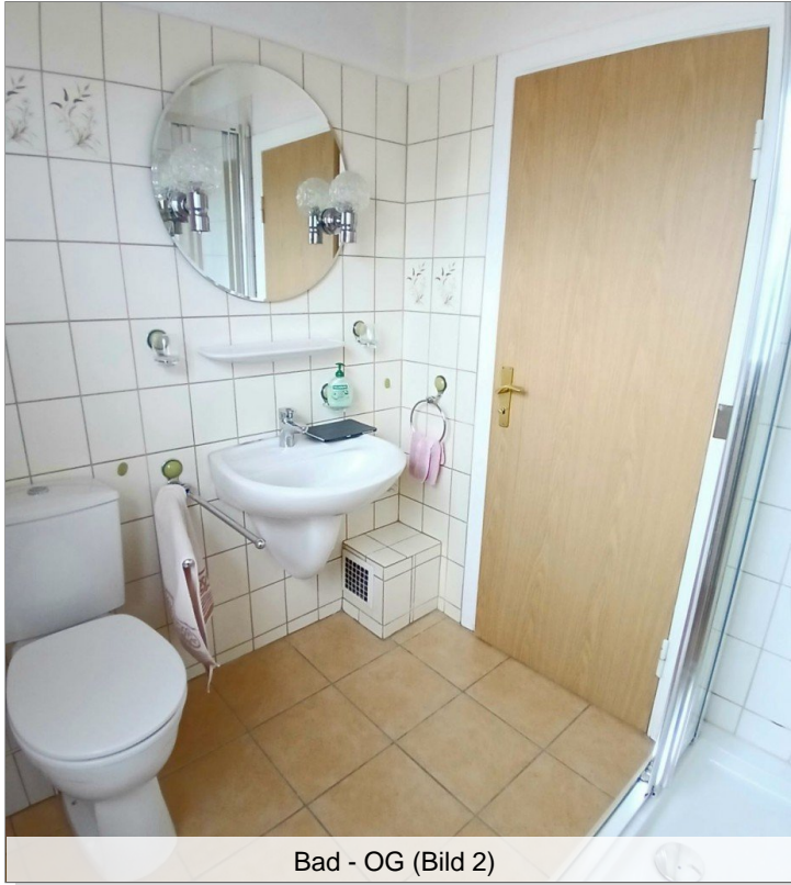
Bad - OG (Bild 2)