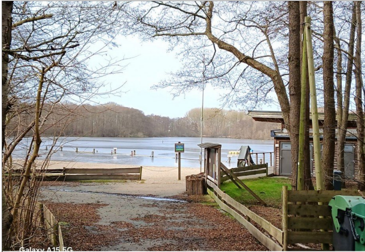
Wakenitz/Naturfreibad "Kleiner See"