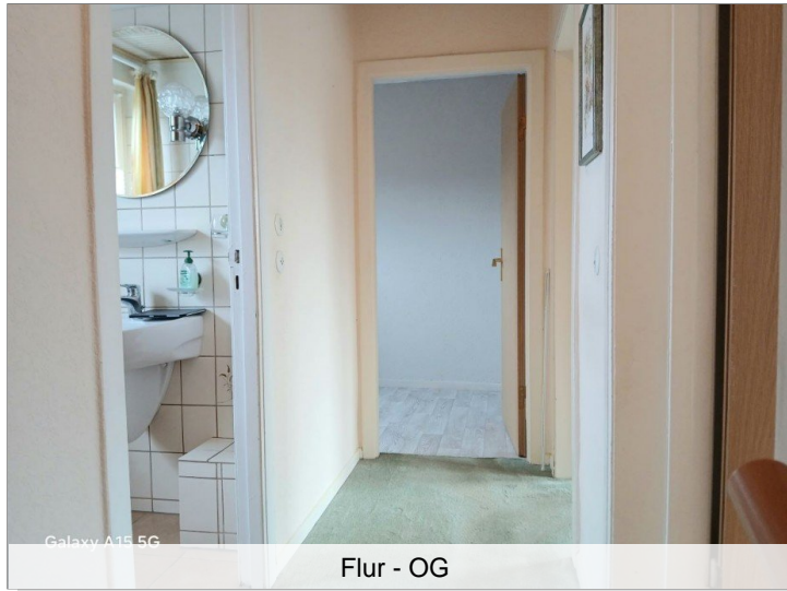
Flur - OG