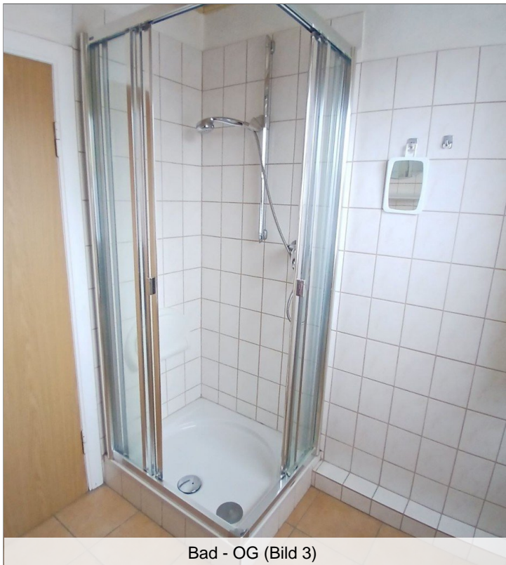
Bad - OG (Bild 3)