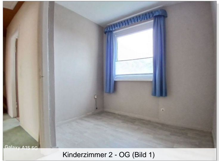
Kinderzimmer 2 - OG (Bild 1)